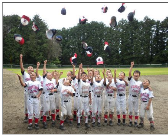
<準優勝 牛久リーグ>