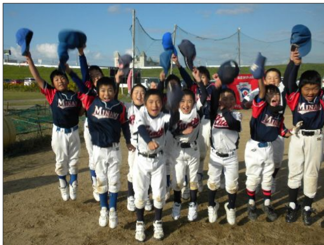
<準優勝:常陸大宮リーグ>