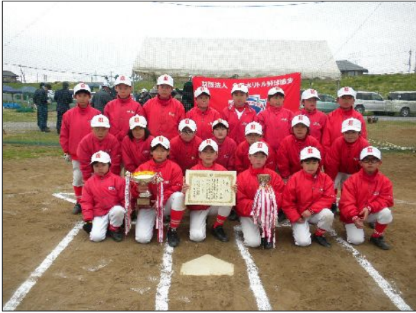
<マイナー優勝:牛久リーグ>