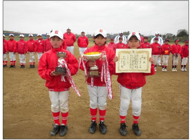
<マイナー準優勝:友部リーグ>