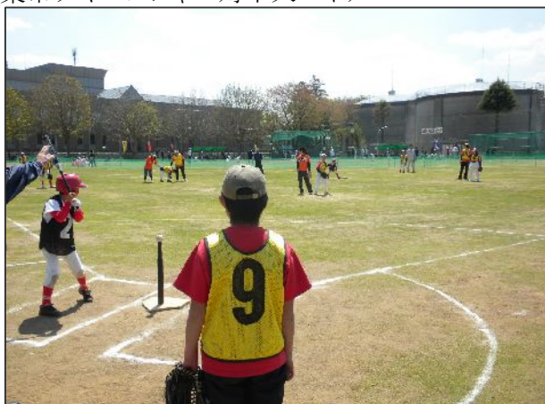
千葉市チャレンジャー対牛久マイナー