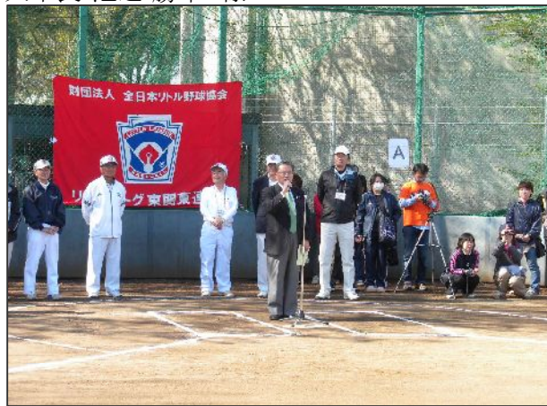
牛久市長 池辺 勝幸 様