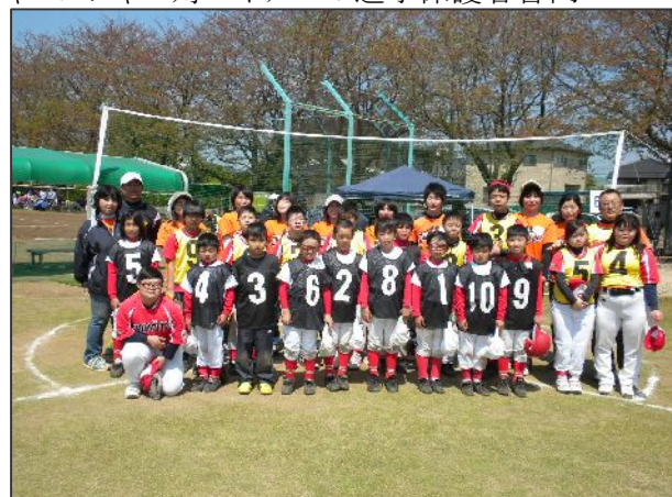
チャレンジャー対マイナーの選手保護者合同