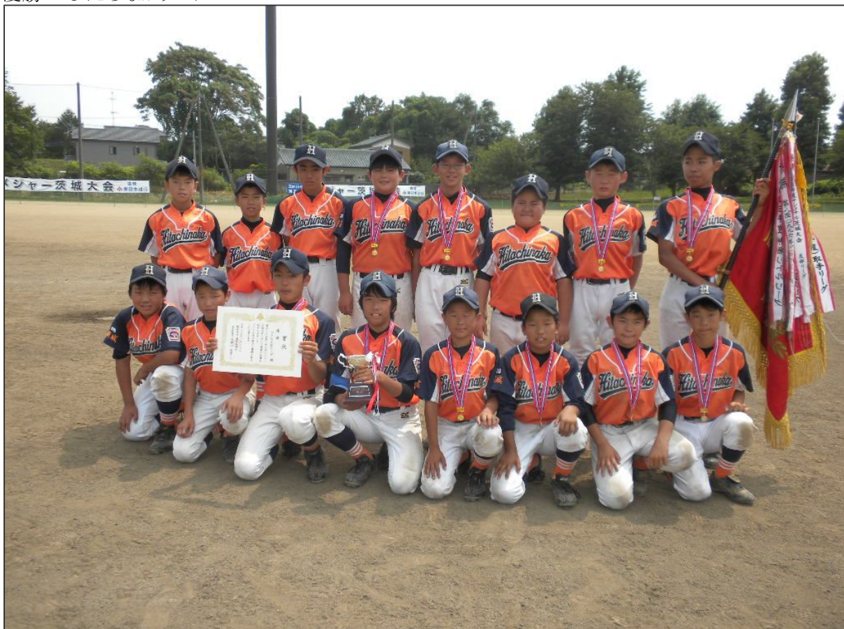
<優勝：ひたちなかリーグ>